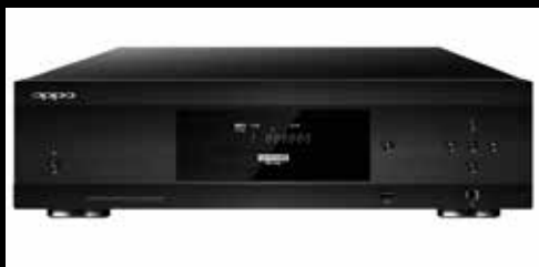
Oppo UDP 205