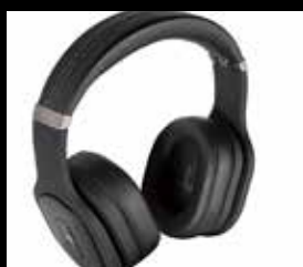
PSB M4U 8