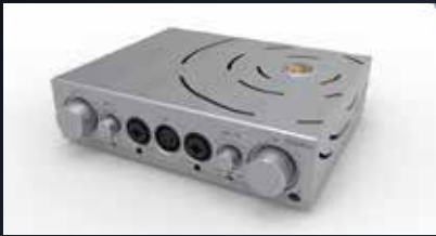
ifi iCan Pro